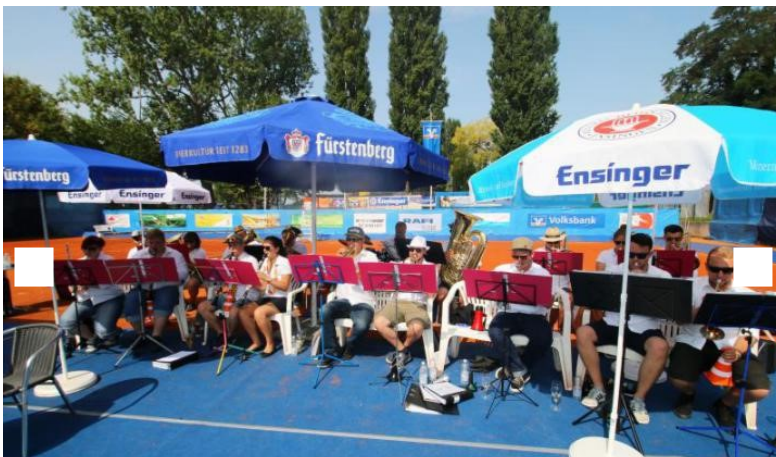
Sorgen für jede Menge zünftige Unterhaltung: die ÜBrassLinger Polka Combo beim Brunch am Sonntagmorgen.

Der Finaltag des Weltranglisten-Tennisturniers beginnt mit Brunch. Lokalmatador René Schulte aus Konstanz gewinnt Doppelkonkurrenz.